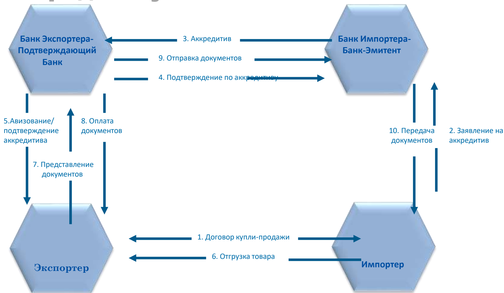
Схема расчетов по экспортному аккредитиву